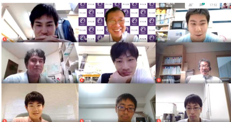
オンラインお茶会の様子