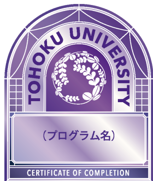
オープンバッジデザイン

東北大学では、大学院共通科目にオープンバッジ※を導入し、以下の要件を満たした学生に、東北大学公認のオープンバッジを発行します。